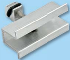
Mittelklemme mit Klemmstein