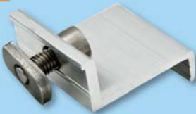
Endklemme mit Zylinderkopfschraube und Gewindeplatte